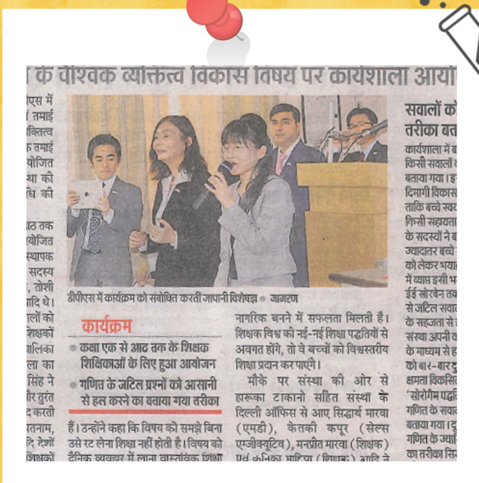
現地の新聞で紹介されました。

※(株)タマインベストメントエデュケーションズのインドでの課外授業のひとつとして、「サイエンスラボ」が採用されました。