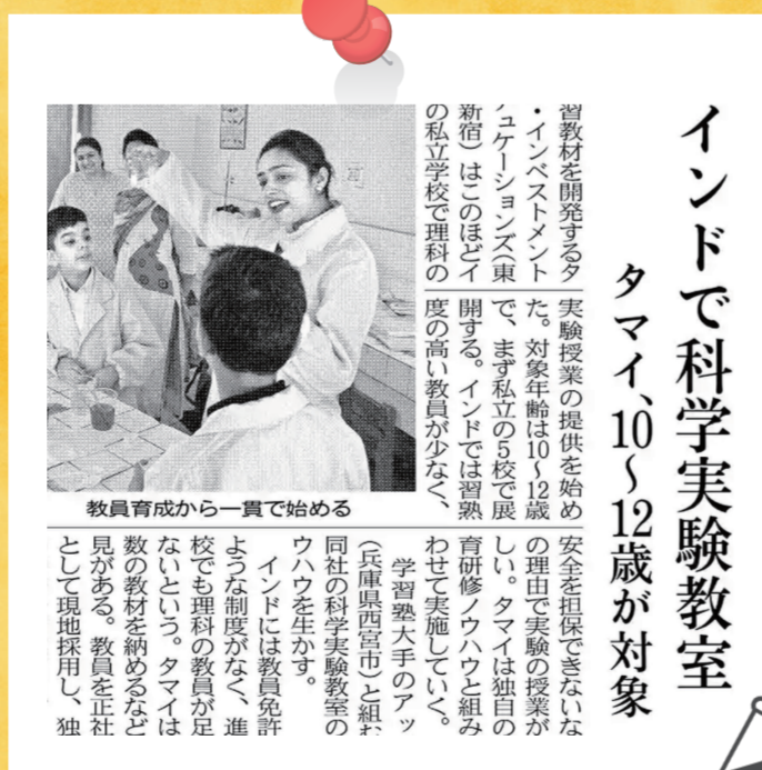
日本経済新聞で、その取り組みが紹介されました。(6月17日(月)朝刊)