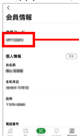
紹介者のアプリ画面 (マイページ 会員情報の画面)