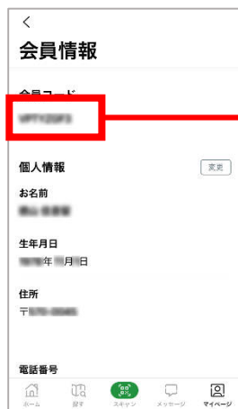
紹介者のアプリ画面 (マイページ 会員情報の画面)